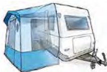
Exempel på campingfordon.