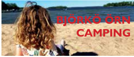
BJÖRKÖ ÖRN CAMPING

Bli medlem och ta del av förmånliga priser på våra campingar samt många andra attraktiva medlemsrabatter. caravanclub.se/bli-medlem