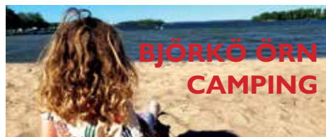
BJÖRKÖ ÖRN CAMPING

Bli medlem och ta del av förmånliga priser på våra campingar samt många andra attraktiva medlemsrabatter. caravanclub.se/bli-medlem